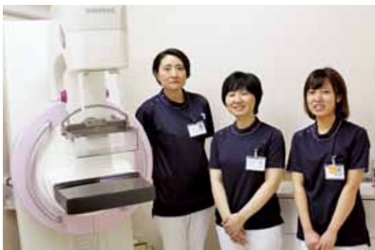
マンモグラフィ担当、女性放射線技師

※当院では、女性の患者さんに配慮するため、マンモグラフィと乳腺超音波検査は全て女性の技師が実施しております。