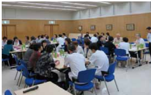
ボランティア団体との情報交換会

“地域とつながるプロジェクト”では、地域住民から信頼され、愛される病院となるため、人と人とのつながりを大切にして、お互いの情報を共有してより良い環境づくりを目的として活動しております。メンバーは医師、看護師の他いろんな職種からの代表15名で構成され、月1回のチーム会議が開催されております。今回は平成28年に行われた情報、意見交換会について紹介いたします。