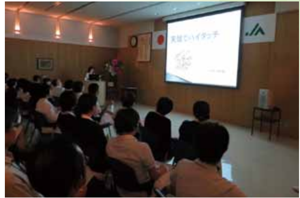
写真は第1回院内接遇自慢大会の様子