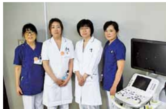
乳腺超音波検査担当、女性検査技師