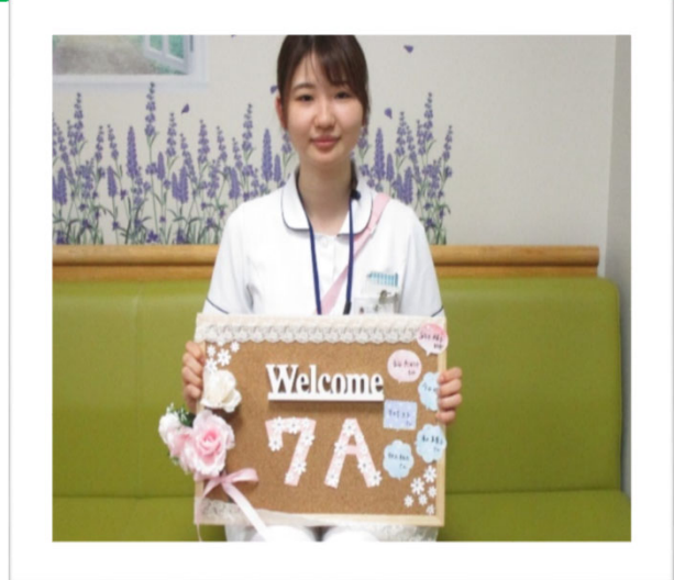
他の病棟のウェルカムボード