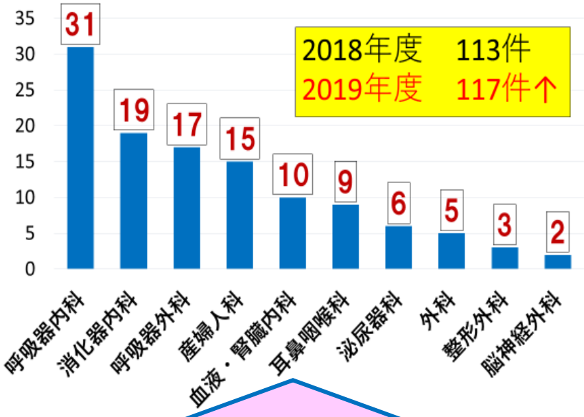
2019年度 診療科別 新規依頼